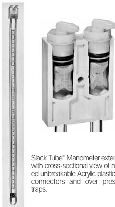
Slack Tube® Manometer extended with cross-sectional view of molded unbreakable Acrylic plastic top, connectors and over pressure traps.

La limpieza se puede realizar acompañada de agua y jabón. Evite solventes, enjuague bien con agua para quitar todos los residuos de jabón. Seque completamente antes de rellenar el manometro con mercurio (Cuando se use este).